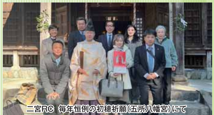
二宮RC 毎年恒例の初穂祈願(五所八幡宮)にて