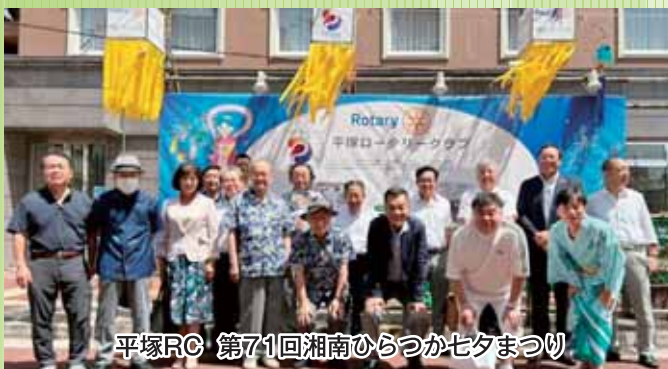
平塚RC 第71回湘南ひらつか七夕まつり