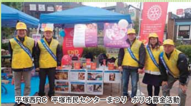
平塚西RC 平塚市民センターまつり ポリオ募金活動