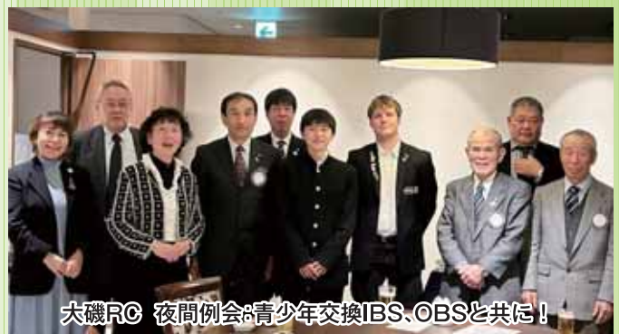
大磯RC 夜間例会:青少年交換IBS、OBSと共に!