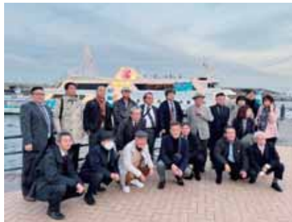
11月企業訪問 横浜マリニルージュ