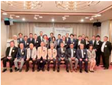
ガバナー公式訪問

また、本年はコロナ過で内向きになった、会員間・家族間や友人とのメンタルヘルスを、健全にさせるために、当クラブにおいて、通年事業で行われている「春の家族会」を、シンガポール国際大会の日程に合わせ、初の海外での実施で外向きに飛び出し、シンガポール平塚ナイトを開催して、会員や家族・友人に希望を生み出す1年にしたいと思います。