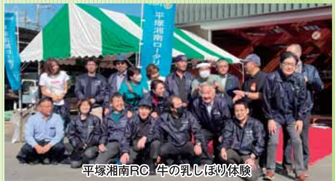
平塚湘南RC 牛の乳しぼり体験