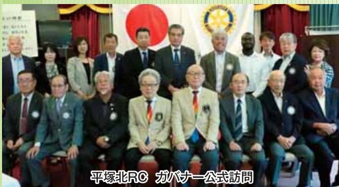
平塚北RC ガバナー公式訪問