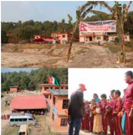
ネパールヒマラヤンアカデミー

そこで昼間に集まらない会員の為にも夜間例会を始めてみました。夜間例会では昼の例会より多くの会員が集まり楽しく会員同士の親睦を深めることが出来ています。このまま会員を維持し続けながら増強にも繋げ、そしてまた今まで以上に奉仕が出来ればと思います。