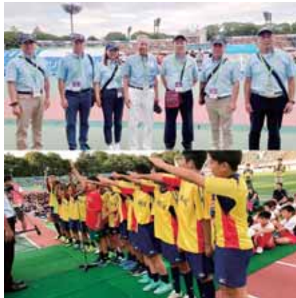
少年サッカー大会