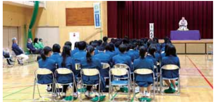
三遊亭わん丈「出前寄席」